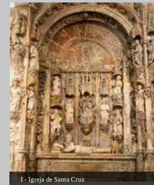
I - Igreja de Santa Cruz

O Mosteiro de Santa Cruz foi fundado em 1131 pela comunidade monástica dos Cónegos Regrantes de Santo Agostinho e, simbolicamente, construído fora da cerca de muralhas da cidade. Foi o primeiro grande monumento românico na cidade. Não obstante D. Afonso Henriques e seu filho D. Sancho I se terem feito aqui sepultar, dele e da sua igreja primitiva já quase nada resta. D. Manuel I promoveu uma profunda remodelação (1495 a 1521) de que resultou o essencial da configuração actual do claustro e da igreja e a construção (1515) das excepcionais arcas tumulares de D. Afonso Henriques e de D. Sancho I, integradas na capela-mor. Local de vénia obrigatória para todos os portugueses!