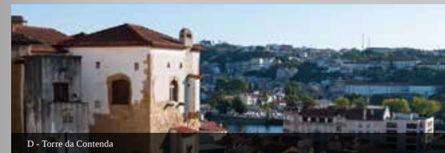
D - Torre da Contenda