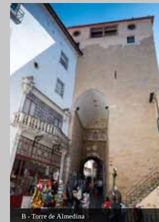
B - Torre de Almedina

Na subida do Quebra Costas, desviando à esquerda, encontra-se junto ao Arco de SubRipas, a Torre da Contenda, antigo elemento defensivo assente sobre a muralha. Quando esta função deixou de ter importância, foi convertida em espaço residencial. O mesmo aconteceu, um pouco mais à frente, com a Torre do Prior do Ameal.