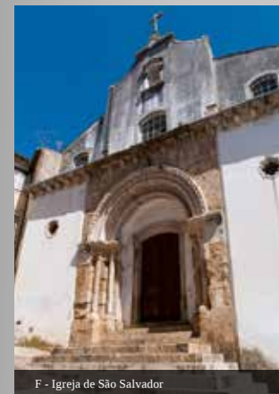
F - Igreja de São Salvador

Templo românico no qual se destacam os portais da frontaria e lateral, particularmente pela composição e escultura dos seus capitéis.