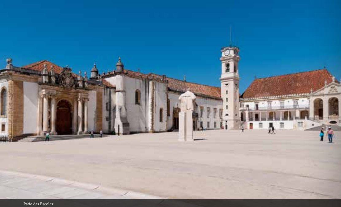
Pátio das Escolas